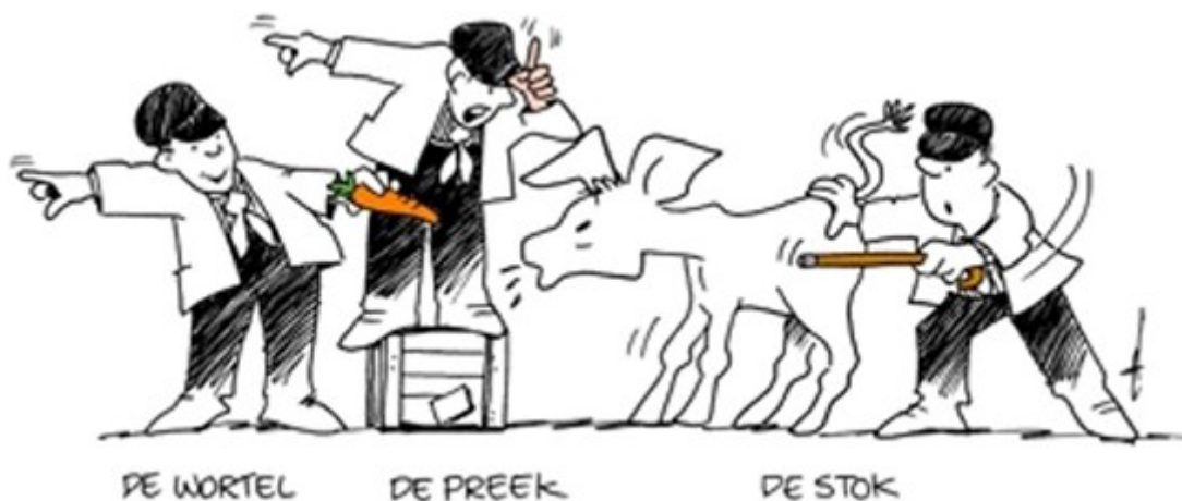
Figuur 1: drie groepen van beleidsinstrumenten. Subsidies zijn te verstaan als 'wortels'

Een overheid kan zich van verschillende instrumenten bedienen om haar beleidsdoelstellingen te realiseren. De bekendste indeling van beleidsinstrumenten is ongetwijfeld die van Evert Vedung (1998). Hij maakt een eenvoudige driedeling van financieel-economische instrumenten (waaronder subsidies), regelgeving en informatieve instrumenten zoals brochures of campagnes. Kort samengevat: wortel, stok, preek (carrots, sticks and sermons).